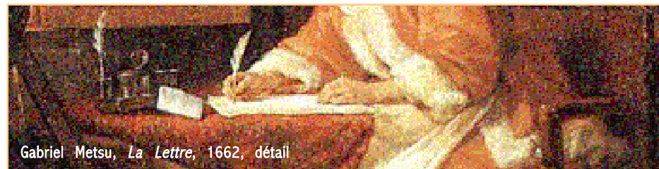
Gabriel Metsu, La Lettre , 1662, détail